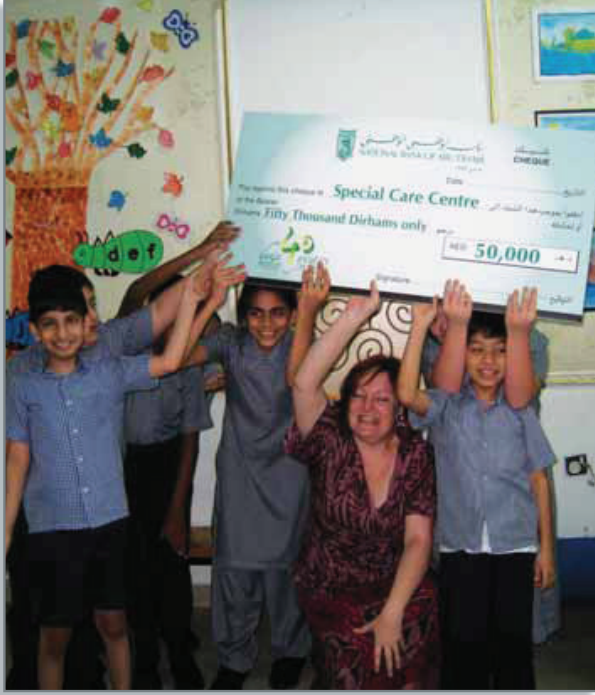
قام بنك أبوظبي الوطني بدعم حملة «طوبى منكم، طوبى لكم» التي أطلقها مركز الرعاية الخاصة

بوصفه شركة مواطنة مهتمة ومسؤولة، فإن بنك أبوظبي الوطني يرمي ويتبرع للمؤسسات غير الربحية والنشاطات المجتمعية والمجموعات الرياضية والثقافية والمهنية والجمعيات الخيرية.