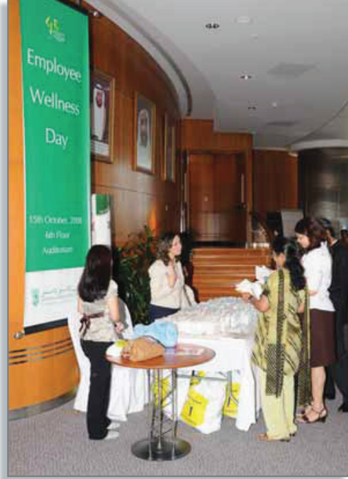
نظم بنك أبوظبي الوطني يوم العافية للموظفين