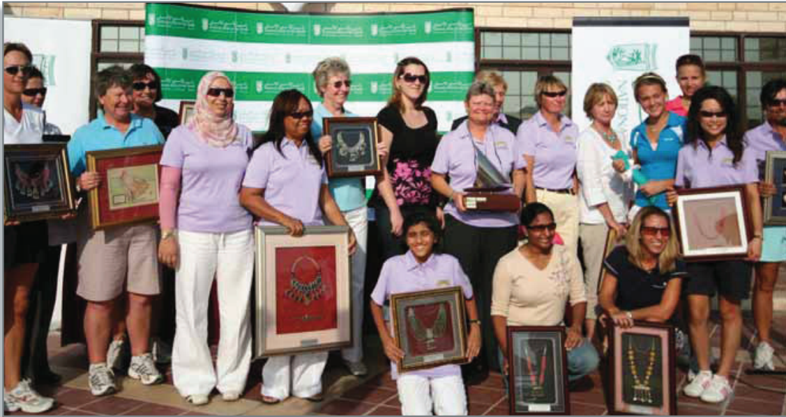
قام بنك أبوظبي الوطني برعاية بطولة الجولف المفتوحة الخامسة والعشرون للسيدات في أبوظبي والتي أقيمت في نادي جولف الغزال